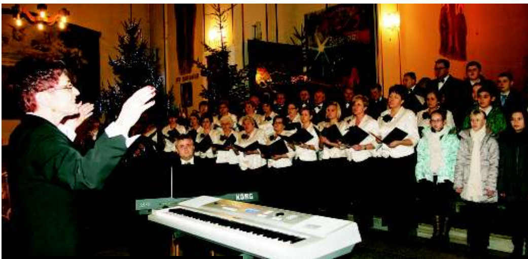
Wspólne kol dowanie w Gierałtowicach