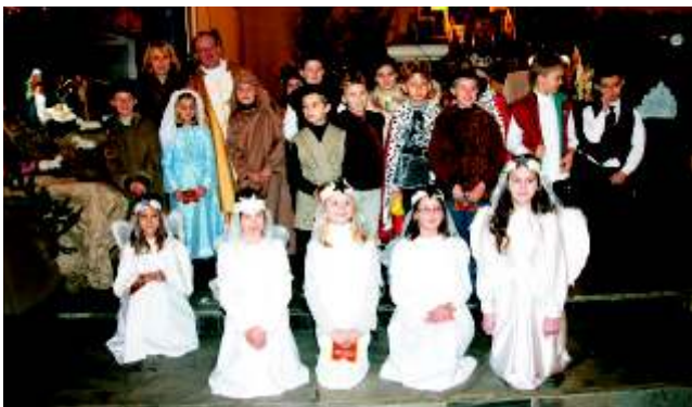
Jasełka w Gierałtowicach