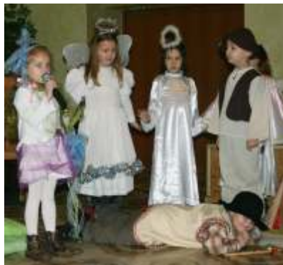
Jasełka w Przyszowicach